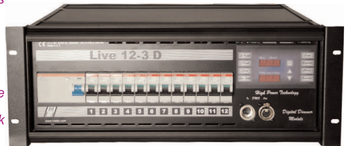
Modèle 12x3 kW rackable 19" avec option interrupteur différentiel 19" rackable 12x3 kW model with RCCD option